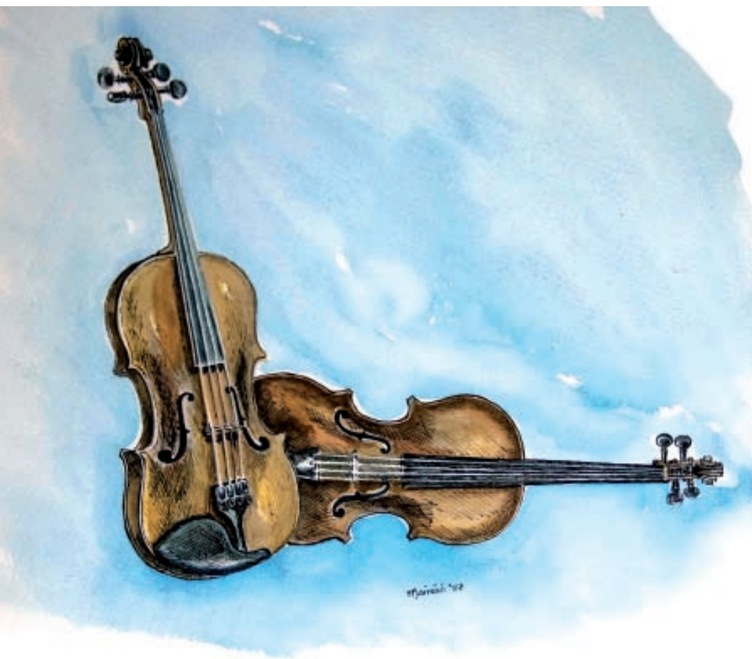
Pictiúr d'fhidleacha a phéinteáil Mairéad.