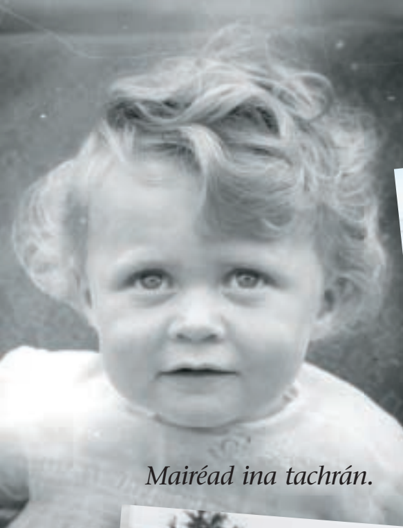
Mairéad ina tachrán.