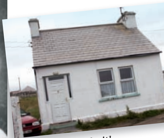
An teach inar chaith Mairéad tús a saoil.